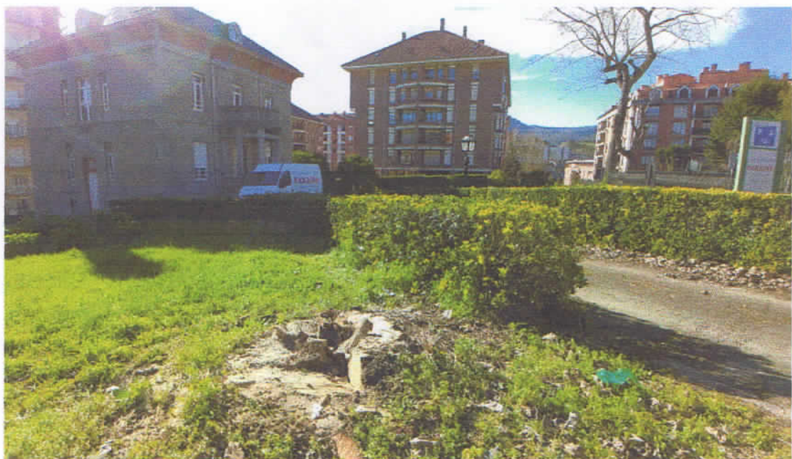
En primer plano, la yuca talada.

A continuación las fotos tomadas el 4 de marzo de la parcela de la casa de Garma después de la tala: