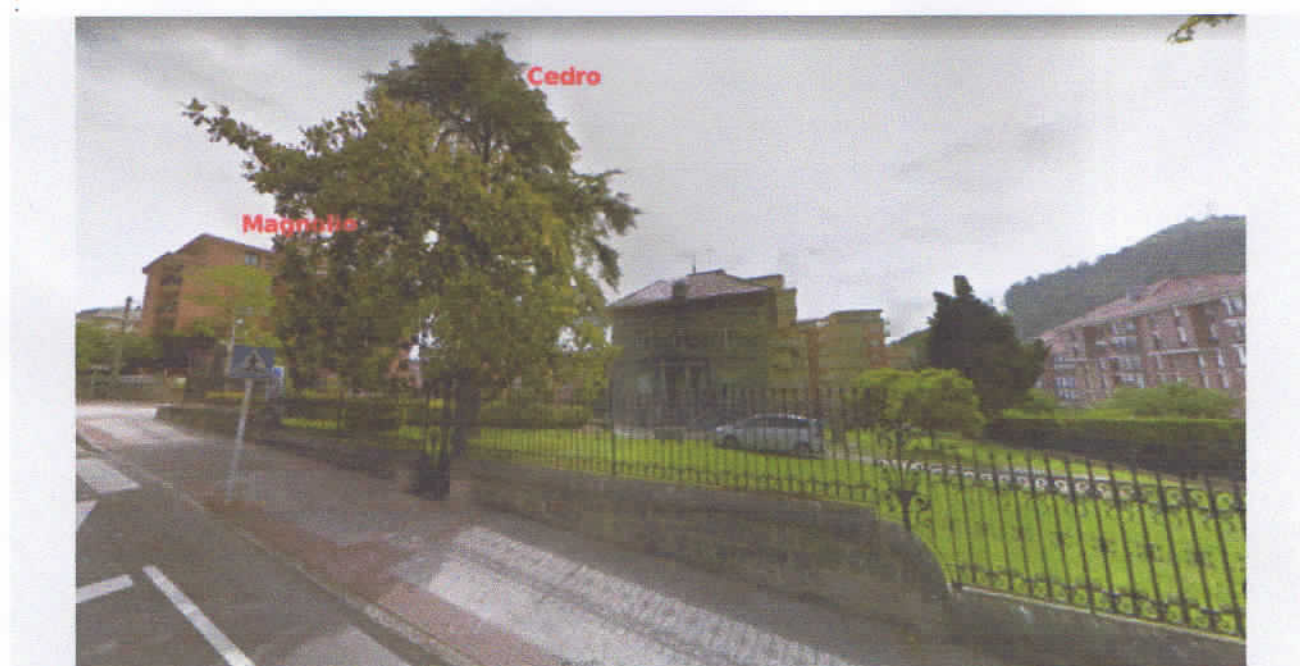
Cedro y magnolio talados dentro de la propiedad de la casa Garma, próximos al paseo Menéndez Pelayo. Más atrás apenas se aprecia una yuca de gran dimensión, también talada. Foto de Google Maps antes de la tala.

Estos árboles gozaban de buena salud, con floración, buen porte, sin indicios que señalaran algún tipo de enfermedad. Los fotos que se exponen a continuación son las del arbolado antes de la tala (fotos obtenidas del Google Maps):