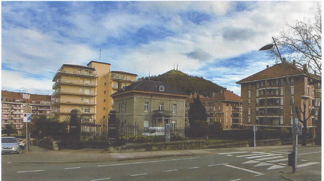
3 de marzo de 2018. Vista general de la finca de Garma, después de la tala.