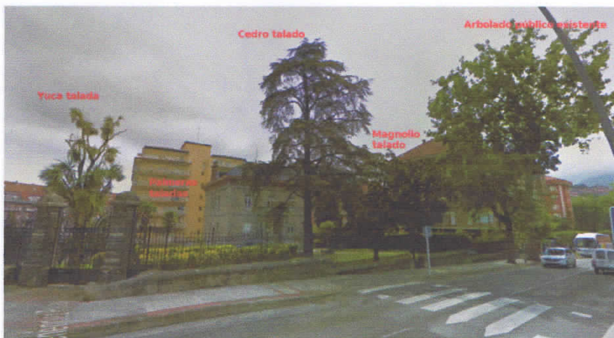
Foto de Google maps antes de la tala, desde la calle Menéndez Pelayo.

Que de acuerdo con la información facilitada por los Servicios Técnicos Municipales no existe licencia de tala del arbolado, aún y a pesar de que la misma es de obligado cumplimiento pues así lo contempla la