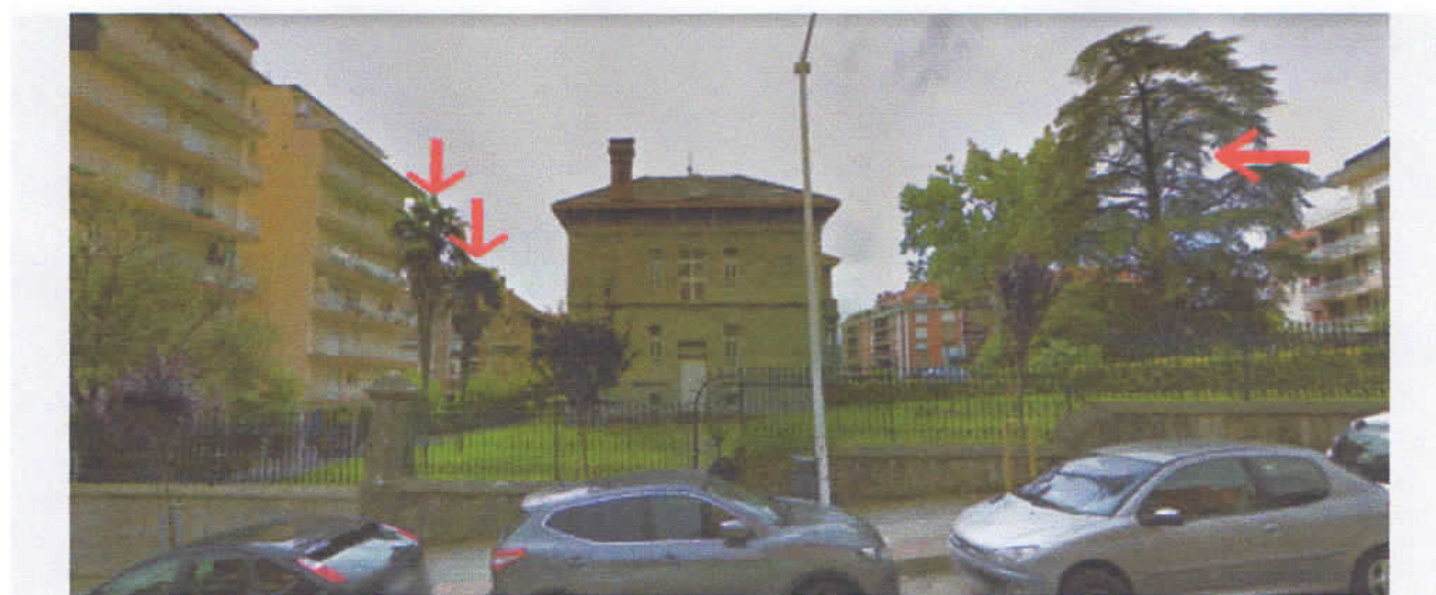
Foto de Google maps antes de la tala, desde la travesía lateral. Las flechas rojas señalan las dos palmeras y el cedro talados.