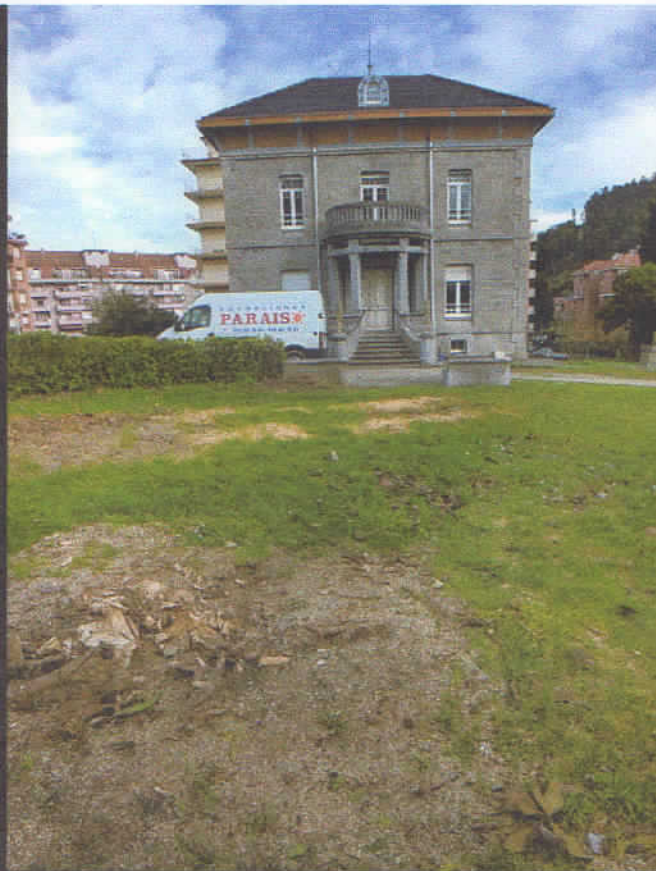
En primer plano los restos del magnolio talado, y un poco más atrás el cedro talado.