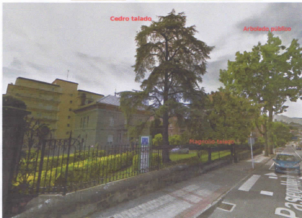
Foto de Google Maps de una parte del jardín, antes de la tala.